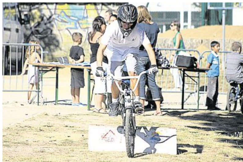
Le BMX, un sport technique pour des grosses montées d'adrénaline.